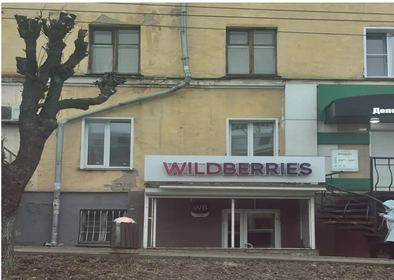
средство наружной информации (вывеска) на козырьке входной группы в нежилое помещение с информацией: «WILDBERRIES», расположенное по адресу: г. Киров, Октябрьский проспект, д. 96