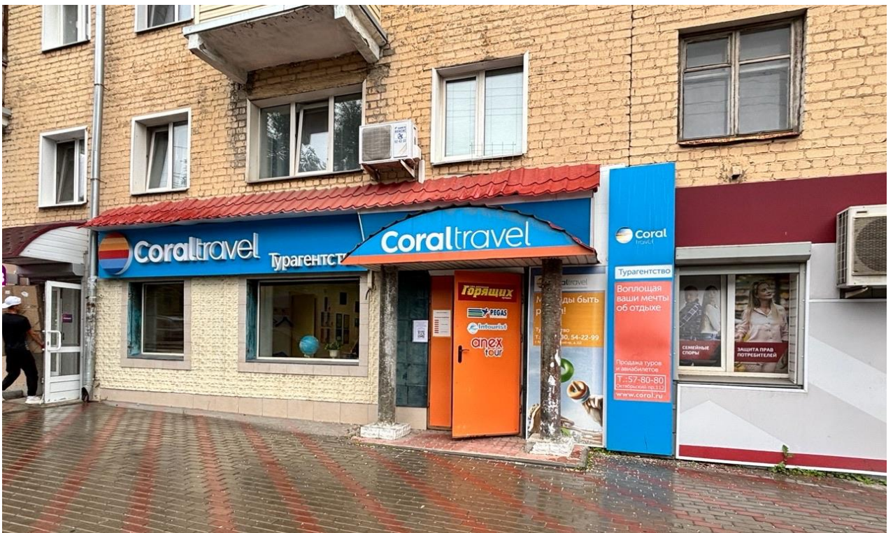
средство наружной информации (вывеска) на фасаде жилого дома с информацией: «Coraltravel турагентство», «Coraltravel Турагентство Воплощая ваши мечты об отдыхе», расположенное по адресу: г. Киров, Октябрьский проспект, д. 112