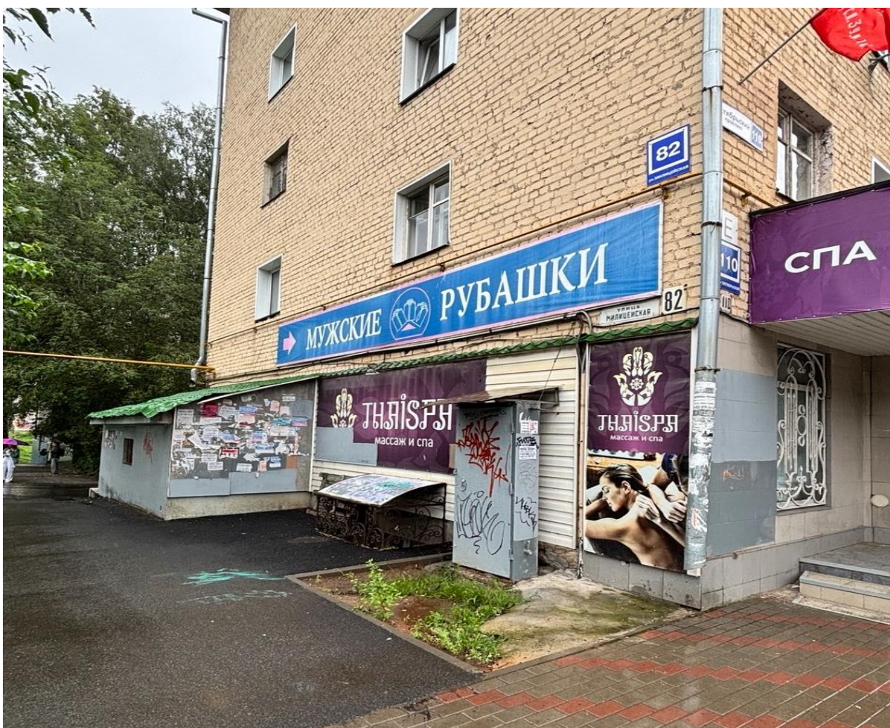
средства наружной информации (вывески) с торца жилого дома с информацией: «ТНАІSPА МАССАЖ И СПА» и на козырьке входной группы в нежилое помещение с информацией: «ТНАІSPА СПА-САЛОН», расположенных по адресу: г. Киров, Октябрьский проспект, д. 110