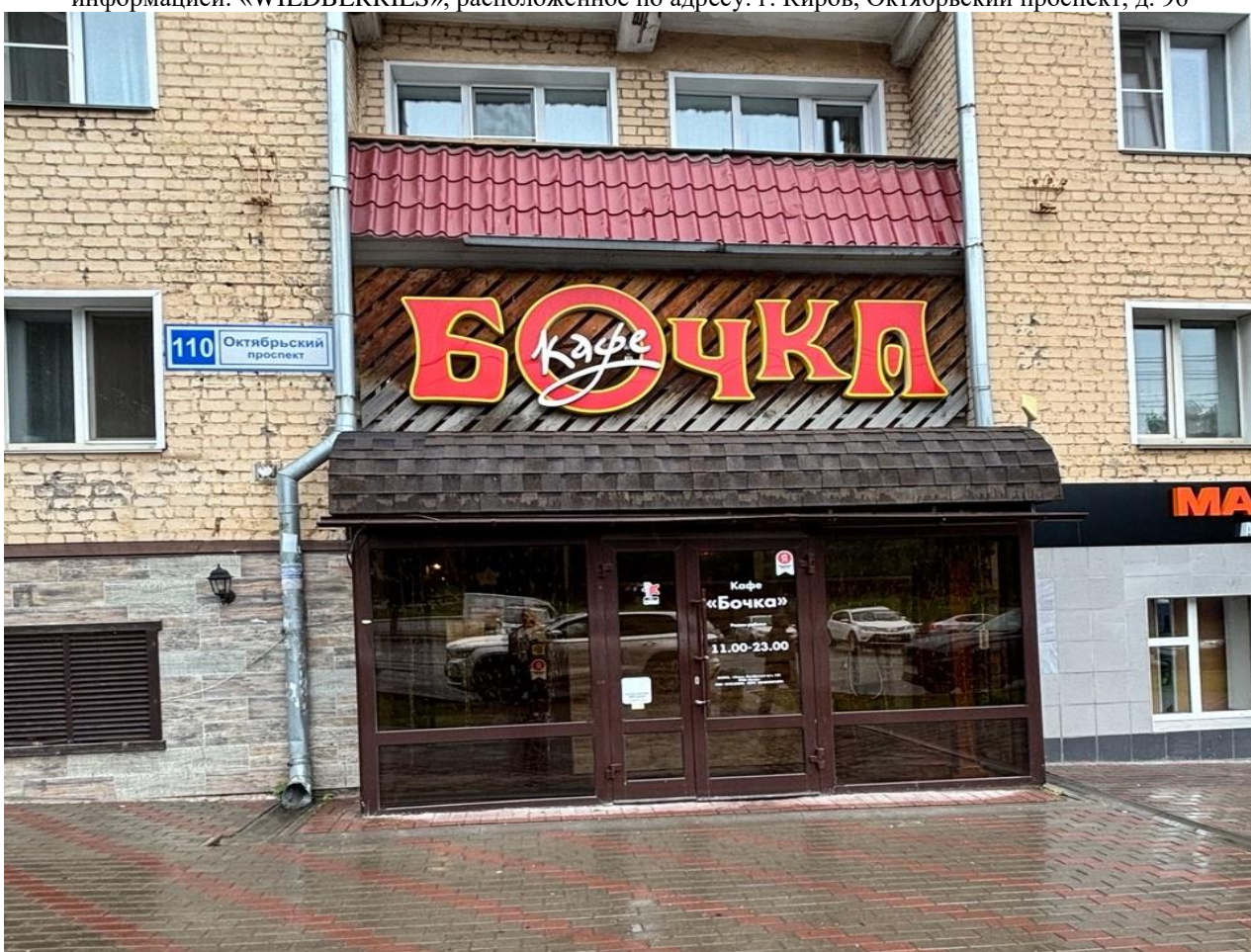
средство наружной информации (вывеска) на фасаде жилого дома с информацией: «кафе БОЧКА», расположенное по адресу: г. Киров, Октябрьский проспект, д. 110