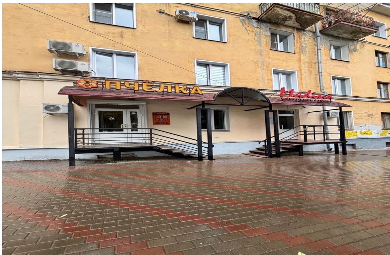
средства наружной информации (вывеска) на козырьках входных групп в нежилое помещение «ПЧЁЛКА», «Madina мебельная студия», расположенных по адресу: г. Киров, Октябрьский проспект, д. 96