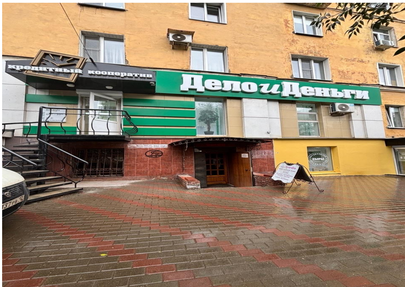
средство наружной информации (вывеска) на фасаде жилого дома с информацией: «Дело и Деньги», расположенное по адресу: г. Киров, Октябрьский проспект, д. 96